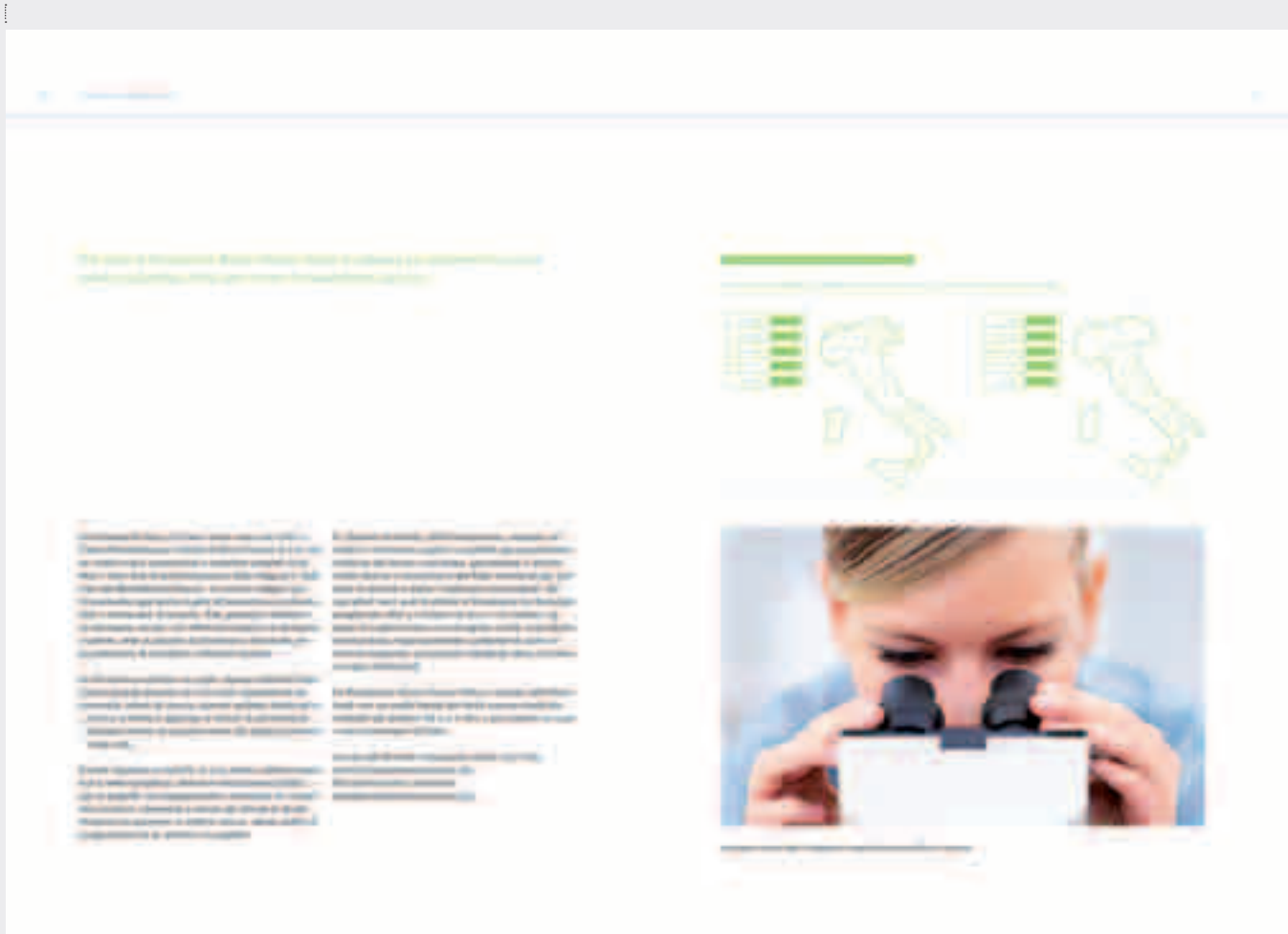
IL PROGETTO SULLA FONDAZIONE, PAG. 10 E 11 / THE FOUNDATION PROJECT, PAGES 10 AND 11

thoroughly reviewed the “Country Reports” in order to make them more usable, starting with Germany as a sample report. This review led to the decision to draw up the reports with a homogeneous structure that included the economic, environmental and social performance indicators broken down for each country, with a commentary on the variances in the individual indicators that have occurred over the last five years.